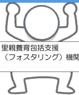
図) フォスタリング機関が、里親さんもファミリーホームも支えます！