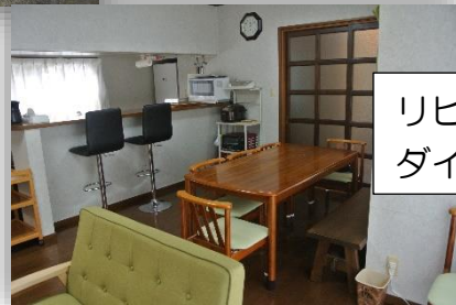
リビング ダイニング