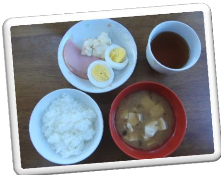
朝食 みそ汁 ポテトサラダ ゆでたまご ロースハム

毎日、毎日の繰り返しの食事が、この子達の将来の食生活になり、家庭を持った時の食卓になります。一食一食を大事にし、一食一食の積み重ねの中から、食べること、生きることを伝えていけたらと思います。これからもよろしくお願ひします。