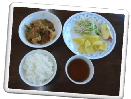
夕食 たらのカレーあんかけ 野菜サラダ さつま芋甘煮 果物